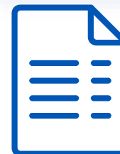
Схема жана нускама

Акча которууга билдирмени жана аны негиздөөчү документтерди ыйгарым укуктуу банкка жөнөтүү схемасы